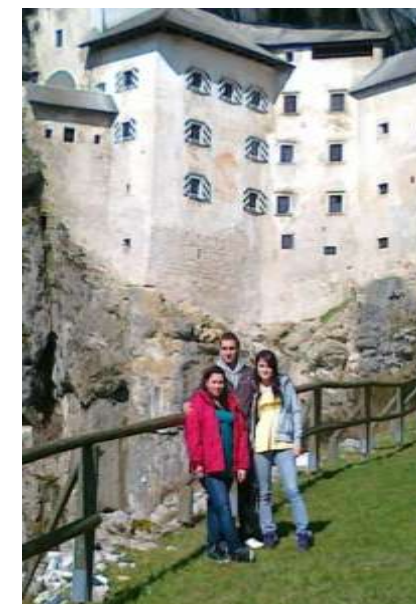
Vrtnarska sola Celje Střední zahradnická škola Mělník