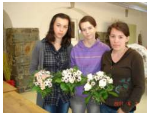
Bildungszentrum Gartenbau Langenlois

(Takto spomínajú na pobyt stážistky z III.Z)