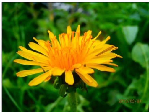
Veselo v škole